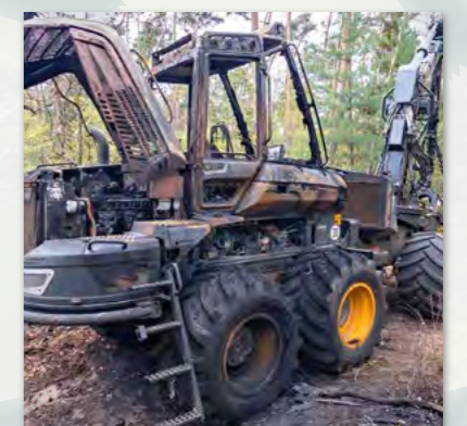
Schadenbilder mit freundlicher Genehmigung.